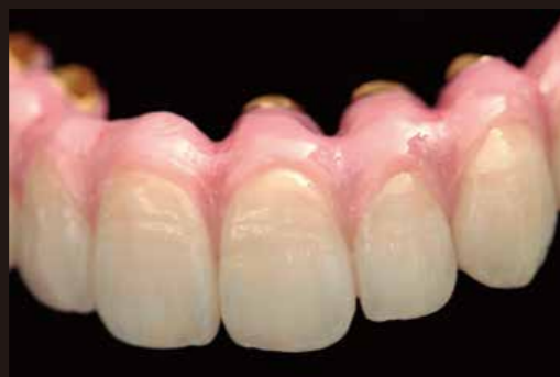
協和デンタル・ラボラトリー